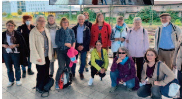
Bruchsal am 30.7.2020