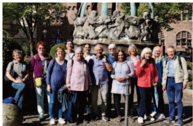
Karlsruhe am 22.9.2023