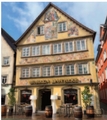
Schwäbisch Gmünd am 1.8.2025

Die Stammtische zu aller Freude Machten uns kulinarisch froh, die Top-illustre Augenweide sorgte für manches Ah und Oh!