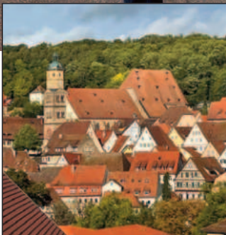
Schwäbisch Hall am 29.9.2022