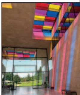
Waldenbuch am 31.7.2024